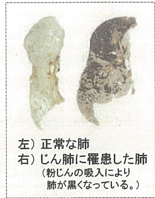
左) 正常な肺 右) じん肺に罹患した肺 (粉じんの吸入により肺が黒くなっている。)

現在、じん肺を治す根本的な治療がないため、じん肺にかからないための措置として、粉じんの発生源対策、局所排気装置等の適正な稼働、呼吸用保護具の適正な着用などにより、粉じんへの「ばく露防止対策」を徹底することが重要です。