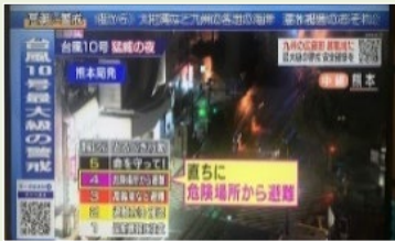
避難情報の報道イメージ（内閣府で撮影）

避難勧告・指示を一本化 し、従来の勧告の段階から 避難指示 を行うこととし、避難情報のあり方を包括的に見直し。