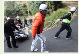
避難行動要支援者が災害時に避難する際のイメージ