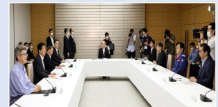
令和2年7月豪雨時の非常災害対策本部