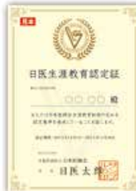
日医生涯教育認定証