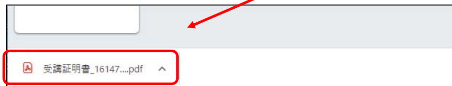
図. ①-2 Chromeの画面例