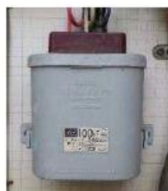
小型コンデンサー