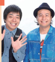
バンビーノ (お笑い芸人)

阪急ブレーブス(現オリックス)→阪神タイガースで活躍。11年連続二桁勝利を記録する。現在は野球解説者、野球評論家として活動している。