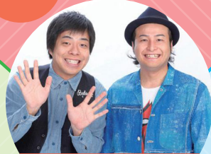
バンビーノ (お笑い芸人)

展示コーナーは 13時からオープン! クイズラリーも開催 クイズに挑戦して オリジナルグッズをゲット!!