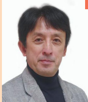
ほしの のぶゆき 星野 伸之 さん (元プロ野球投手)

阪急ブレーブス(現オリックス)→阪神タイガースで活躍。11年連続二桁勝利を記録する。現在は野球解説者、野球評論家として活動している。