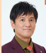
ヤナギブソン (総合司会)

お笑いユニットザ・プラン9のメンバー。ピン芸人としても活動。「R-1ぐらんぶり」2003・2012・2013ファイナリスト。