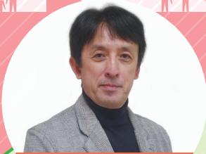
星野 伸之さん (元プロ野球投手)